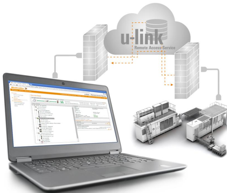
Bild 2: Weidmüller Systemlösungen: Vereinfachte Servicelösungen für eine gesteigerte Anlagenproduktivität.